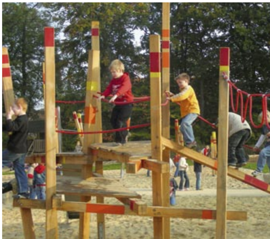
Eine ähnliche Spielkombination wird hier aufgestellt.

finden. Ebenfalls über den Platz verteilt gibt es neue Sitzelemente namens „happy hour“ in einem Orangeton zum Ausruhen und Lümmeln, wie sie schon auf dem gegenüberliegenden Grundschulhof zu finden sind, sowie einfache Betonbänke mit Holzauflagen.