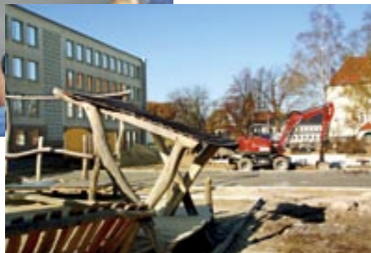
Noch ist der Hof eine Baustelle, aber bald tummeln sich hier die Schüler.

Die Teile drei und vier werden Spielangebote für die Schüler vorhalten. Für die wärmere Jahreszeit entsteht hier ein Wasserspielplatz mit zwei Handpumpen und Wasserspielelementen. Der weitere Bereich erhält Spielkombinationen zum Klettern und Rutschen sowie eine Torwand für Zielübungen angehender Fußballer.