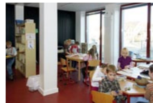
Basteln, malen, erzählen – der neue Kreativraum ist beliebt.