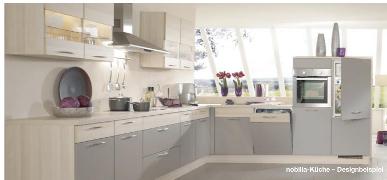
nobilia-Küche – Designbeispiel