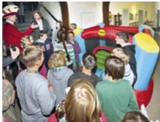
Einladung zum Sprung im Rathausflur: Ein ungewöhnlicher Ort für den Indoorspielplatz.