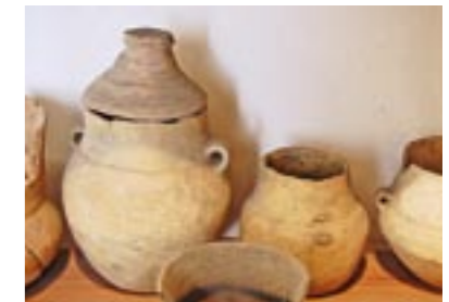
Das Heimatmuseum: ein Kleinod voller Schätze der Calauer Geschichte