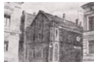
Das ehemalige Amtsgerichtsgefängnis 1928