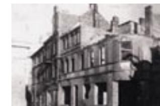
Zerstört im Krieg 1945