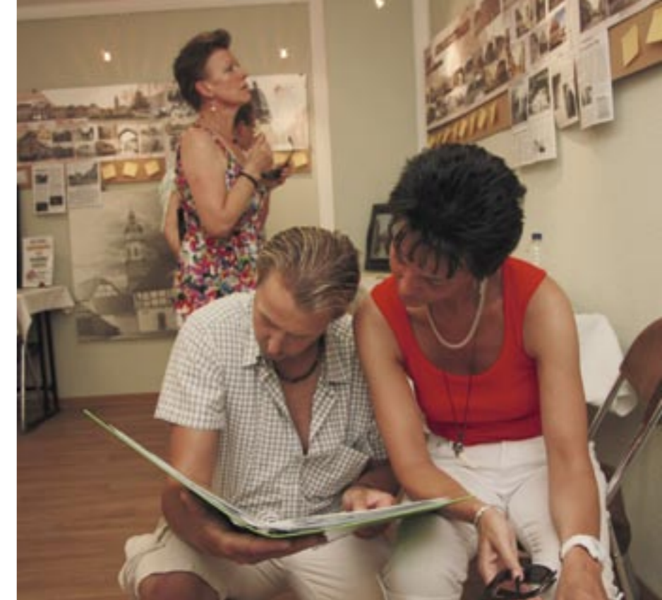
„Calau interaktiv“ – die Ausstellungsserie im Haus der Heimatgeschichte

Bilder Museum und Besucher: Matthias Nerenz Bild krüge: Stephan Uhlig