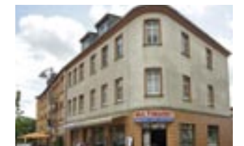
Der Bau in seiner heutigen Form