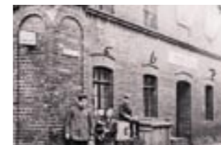
Hier sind die Gitterstäbe noch klar zu erkennen (1928)