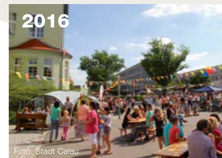
2016 Grund- und Oberschule sind eins