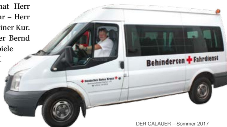
DER CALAUER – Sommer 2017

Auch für private Termine stehen die Mannen des DRK bereit – von der Fahrt zum Einkauf bis hin zur Familienfeier. Je nach Beeinträchtigung werden auch hierfür die Kosten von den Kranken- beziehungsweise Pflegekassen übernommen.