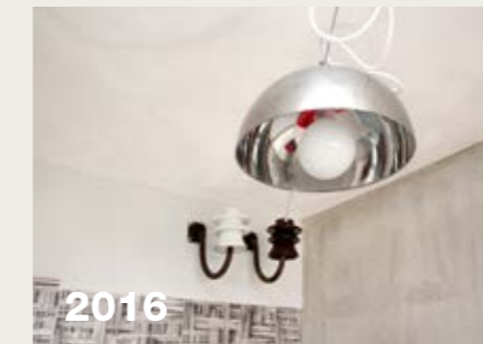
2016 WBC-Musterwohnung „Loft“