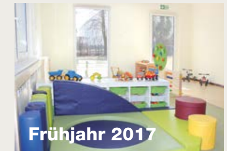
Frühjahr 2017 Die Kita braucht weitere Räume: Eine Außenstelle wird errichtet.