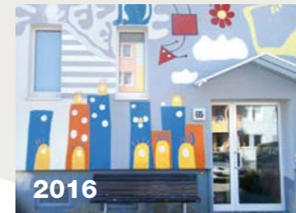
2016 Die neue Kunstfassaden in der Otto-Nuschke-Straße