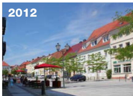
2012 Pilotprojekt im Land: Gemeinsam genutzter Raum in der Cottbuser Straße