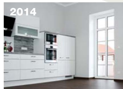
2014 WBC-Musterwohnung „Elegance“