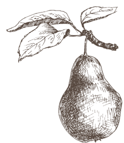
Die alten, selten gewordenen Birnensorten auf dem Platz wurden erhalten.

Das historische Herz Calaus gibt den Historikern auch weiterhin Rätsel auf. Ist es die Dunkelsburg, welche in einer historischen Urkunde benannt ist oder nicht? Die bei der archäologischen Begleitung des Projektes gefundenen weiteren Mauerreste sind dokumentiert worden. Eine eindeutige Zuordnung konnte aber noch nicht erfolgen.