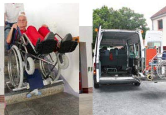
DER CALAUER – Sommer 2018