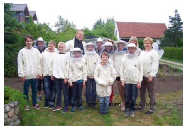
DER CALAUER – Sommer 2018