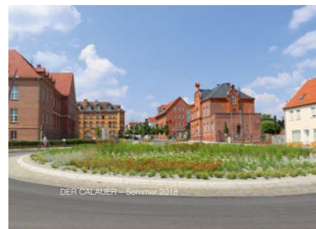
DER CALAUER – Sommer 2018