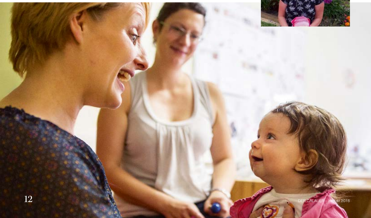
DER CALAUER – Herbst 2018

sich die Kinder freuen, wenn ich komme. Die Fragen der jungen Eltern sind ganz vielfältig. Manchmal geht es um Ernährungsthemen, aber oft einfach um Alltagssituationen. Ich bin Informationsgeberin, Vermittlerin, Unterstützerin – immer da, wenn ich gebraucht werde. Ich hole die Kinder auch aus der Kita ab oder behalte sie ein bis zwei Stunden, wenn die Eltern mal Zeit für sich benötigen. Mein Ehrenamt macht mich zur Vielfach-Patentante, die im Moment sechs Familien begleitet. Und mein Mann sagt immer: „Wenn die Kinder da sind, dann hast du dieses besondere Leuchten in den Augen.“