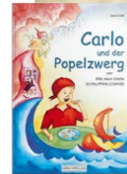
Carlo und der Popelzweg

Als Mutter von drei Kindern hat sie schon oft erfolgreich gegen Erkältungen gekämpft. Aber einmal war alles anders. Da war nämlich der „Popelzweg“ schuld. Das behauptete zumindest ihr Sohn. Aus Freude über die kindliche Fantasie gab sie der Figur ein Aussehen und schrieb eine witzige „Gesund-werde-Geschichte“ dazu. Die Genesung folgte prompt und der Gedanke ein eigenes Kinderbuch zu machen, ließ sie nicht mehr los. Als freiberufliche Grafikdesignerin, Künstlerin und Bücherwurm lag das nahe, wenn auch nicht von Anfang an geplant.