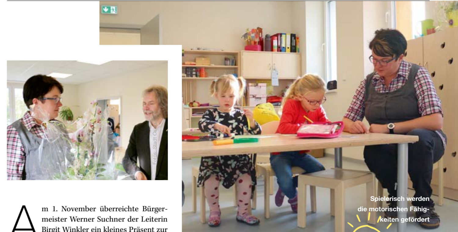
Spielerisch werden die motorischen Fähigkeiten gefördert

Im ehemaligen Bauamt ist es etwas turbulenter geworden