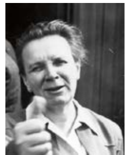
Amtszeit als Vorsitzende von 1965 bis 1971

rität“ gebildet, wodurch eine Neubildung der Arbeiterwohlfahrt unmöglich geworden war. Am 12. Juli 1948 wurde der Hauptausschuss für Arbeiterwohlfahrt schließlich in das Vereinsregister beim Amtsgericht Hannover eingetragen. Die AWO wurde so zu einem gemeinnützigen Verein. Und ab November 1989 gründeten sich unter der „Patenschaft“ der westdeutschen AWO Verbände die ersten Verbände der Arbeiterwohlfahrt im Osten. Am 10. November 1990 schlossen sich die Landes- und Bezirksverbände der Arbeiterwohlfahrt in ganz Deutschland zusammen.