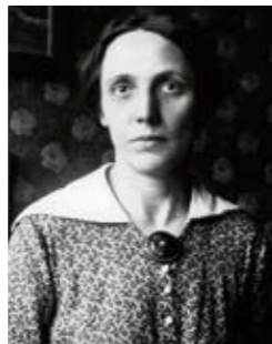
Marie Juchacz Gründerin der Arbeiterwohlfahrt

Seit 100 Jahren kämpft die AWO für Gerechtigkeit, Solidarität, Vielfalt und Frauenrechte sowie ein menschenwürdiges Leben, in dem niemandem Almosen zugeteilt, sondern allen Chancen für Teilhabe ermöglicht werden. Richtungsweisend für alle Mitglieder steht die AWO Gründerin Marie Juchacz. Die engagierte Frau hatte zur Gründung im Jahr 1919 ganz sicher nicht im Sinn gehabt, dass die Arbeiterwohlfahrt rund 100 Jahre später von über 335.000 Mitgliedern, 66.000 ehrenamtlich engagierten Helfenden sowie 215.000 hauptamtlichen Mitarbeitenden getragen wird.