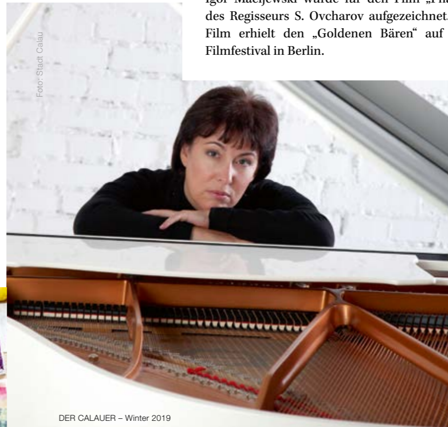
DER CALAUER – Winter 2019